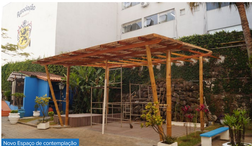
Novo Espaço de contemplação