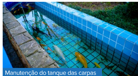
Manutenção do tanque das carpas

o uso de máscara, e, em alguns deles – como no basquete – sem contato físico. E deu certo.