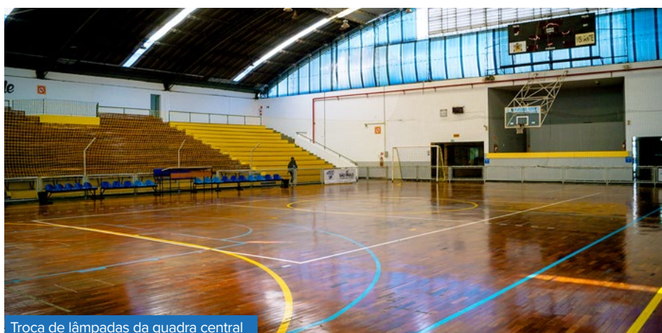
Troca de lâmpadas da quadra central