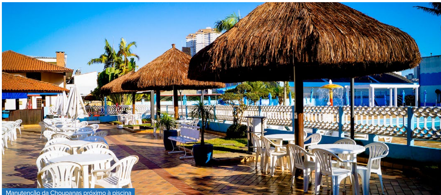
Manutenção da Choupanas próximo à piscina

A pandemia da COVID-19 assola o mundo desde o início de 2020. O mundo precisou se adaptar. As pessoas precisaram se adaptar: ficar em casa, em quarentena. Como seria? Quanto tempo seria? O que essa pandemia deixaria de legado e porquê?