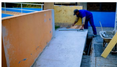
Obra de acessibilidade ao parquinho e saída da piscina

Mais de dois anos após esses questionamentos iniciais, as respostas nem sempre estão claras. Alguns setores da sociedade foram diretamente