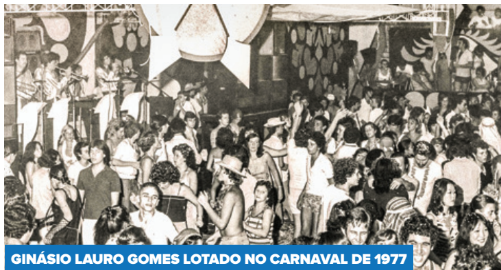
GINÁSIO LAURO GOMES LOTADO NO CARNAVAL DE 1977