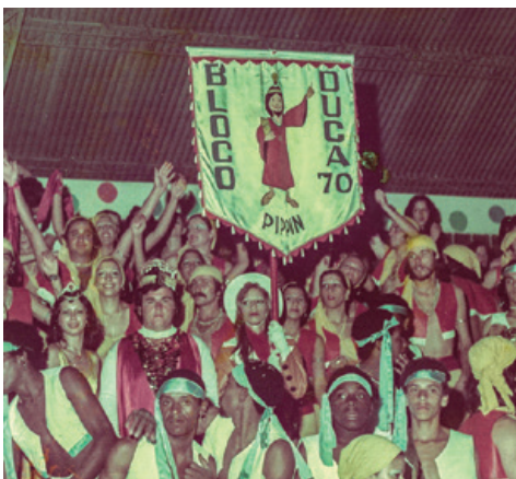
BLOCO DUCA 70 DURANTE CARNAVAL

A folia de Carnaval nos anos 90 chegava a atrair mais de 3 mil pessoas no Ginásio Lauro Gomes. "Foi um projeto grandioso. E sempre unimos o clube para que tanto o Carnaval quanto as outras festas ao longo