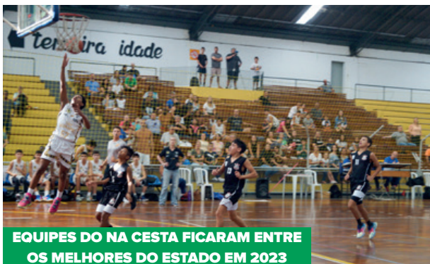
EQUIPES DO NA CESTA FICARAM ENTRE OS MELHORES DO ESTADO EM 2023

NA CESTA – o projeto Na Cesta é voltado para a prática do basquete e também está no clube desde 2015. Por aqui, os jogos são das categorias SUB 13 e SUB 14 masculina. O Na Cesta tem por objetivo trabalhar a formação desportiva na modalidade, propiciando assim o desenvolvimento de um trabalho esportivo já iniciado.