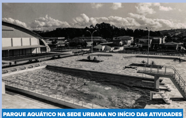
PARQUE AQUÁTICO NA SEDE URBANA NO INÍCIO DAS ATIVIDADES