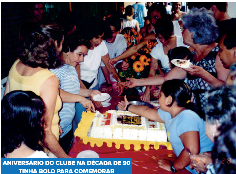
ANIVERSÁRIO DO CLUBE NA DÉCADA DE 90 TINHA BOLO PARA COMEMORAR

Outro grande momento de festa no clube foram os grandes carnavais no Ginásio Lauro Gomes. Em algumas edições, com direito a carro alegórico, concurso de fantasia, rei momo, rainha, além de abadá personalizado e uma decoração exclusiva.