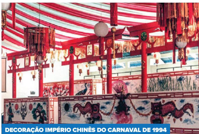
DECORAÇÃO IMPÉRIO CHINÊS DO CARNAVAL DE 1994