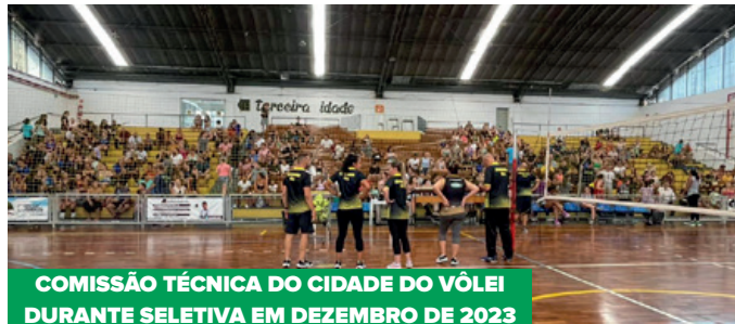
COMISSÃO TÉCNICA DO CIDADE DO VÔLEI DURANTE SELETIVA EM DEZEMBRO DE 2023