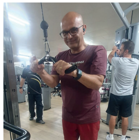
O AGENTE DE SEGURANÇA TAMBÉM É ASSÍDUO DA ACADEMIA PARA MANTER A FORMA NA MUSCULAÇÃO

Ele reitera a importância sempre dos pais, responsáveis e amigos estarem de olho nas crianças. “Temos a possibilidade de estar em um clube